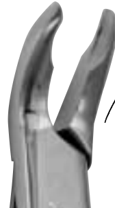
大臼・智歯用 No.8(腕曲)