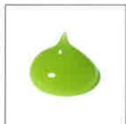
使いやすいジェルタイプ