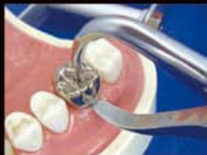
②プライヤー先端突起部を穿孔部位に差込み、もう一方はマージン部に引っ掛ける