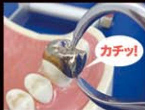
③ハンドルを握りこみ撤去