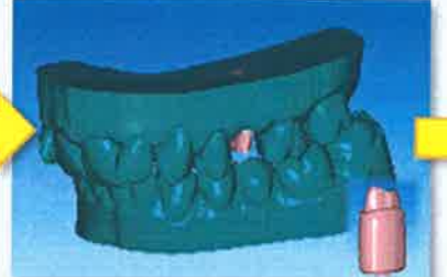
模型データのデザイン (exocad Model creator)