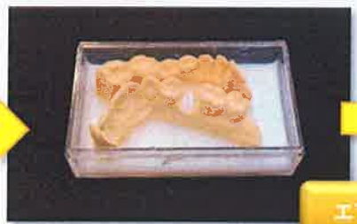
専用石膏硬化材(Base)に 全体をつける