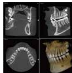
■CT I-mode \phi 90mm \times 91mm(H)