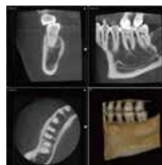
■CT D-mode \phi 51mm \times 55mm(H)