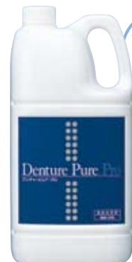
デンチャーピュア・プロ