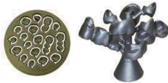
※1 単冠、小白歯の場合、症例により変動

歯科用CADで設計した クラウン、ブリッジおよび、パーシャルデンチャーフレームなどをワックスディスクからスピーディーに削り出します。加工したパターンを鑄造して金属やプレスセラミックに置き換えます。WAXY Plus はワックスを高速に加工でき、従来の技工製法を CAD/CAM 設計で運用するのに最適です。