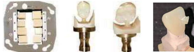
※2 加工時間は1本あたり約20分～30分

前歯、小臼歯、大臼歯の各社CAD/CAM冠ブロックに対応します。連続8ブロックまで加工が可能です。新しい前歯などのグラデーションブロックにも対応、