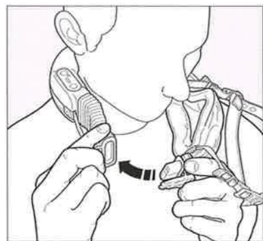
2. マスクを接続します