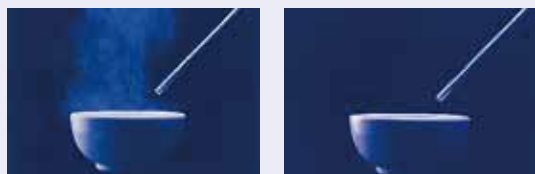
非だストフリー品